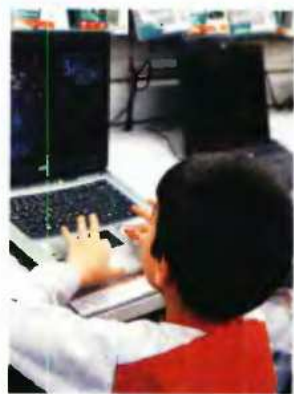
▲ ΤΟ 55% των παιδιών παραδέχονται ότι έχουν δεχθεί επικοινωνία με άγνωστο στο Διαδίκτυο

ΨΗΦΙΑΚΑ «αναλφάβητοι» παραμένουν πολλοί γονείς στη χώρα μας. Μόνο ο ένας στους τρεις δηλώνει ότι έχει πάρα πολύ καλή σχέση με το Διαδίκτυο και ένας στους τέσσερις παραδέχεται ότι γνωρίζει και αξιοποιεί τα εργαλεία γονικού ελέγχου. Στο συμπεράσμα αυτό κατέληξε έρευνα της Microsoft σε 669 Έλληνες γονείς, η οποία κατέδειξε επίσης πως το 18% των γονέων δεν έχει καθόλου καλή ή έχει ελάχιστη σχέση με το Ιντερνετ, ενώ το 52% δήλωσε ότι έχει μέτριες γνώσεις. Αποτέλεσμα είναι σχεδόν ένας στους δύο γονείς (48%) να δηλώνει μεν σίγουρος ότι το παιδί του λαμβάνει τις απαραίτητες προφυλάξεις όταν «σερφάρει» στο Ιντερνετ, χωρίς ωστόσο να μπορεί να το ελέγξει με ακρίβεια. Κι αυτό γιατί από το σύνολο των συμμετεχόντων στην έρευνα, μόνο το 28% έχει ταποθετήσει τον υπολογιστή στο σολόνι του ασιπού, ενώ περιορισμούς στον χρόνο που περνούν τα παιδιά στο Διαδίκτυο θέτει μόλις το 32% των γονέων. Στον αντίποδο, το 15% παραδέχεται ότι δεν έχει προβεί σε καμία απολύτως δράση και το 61% του συνόλου δηλώνει ότι δεν γνωρίζει αν το παιδί του έχει ενεργοποιήσει ρυθμίσεις ασφαλείας στο προφίλ του στις σελίδες κοινωνικής δικτύωσης.