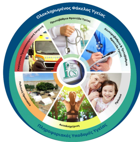
Εικόνα 2 Τεχνολογίες για την παροχή ολοκληρωμένων λύσεων (ψηφιακής) υγείας.

Ιδιαίτερη έμφαση δίνεται στις συνεργασίες για την αποτελεσματικότερη μεταφορά τεχνολογίας. Το Κέντρο Εφαρμογών και Υπηρεσιών Ηλεκτρονικής Υγείας είναι μέλος της συντονιστικής ομάδας του Κέντρου Αναφοράς τεσσάρων αστέρων του ΙΤΕ για την Ευρωπαϊκή Σύμπραξη Καινοτομίας για την Ενεργό και Υγιή Γήρανση. Συνενώνει φορείς της «τετραπλής έλικας» καινοτομίας όπως πανεπιστήμια, ερευνητικά κέντρα, φορείς υγείας, επιχειρήσεις και συλλόγους πολιτών σε ένα ενιαίο οικοσύστημα, ώστε να αναδείξει αλλά και να δημιουργήσει νέες τεχνολογίες και υπηρεσίες για τη βελτίωση της υγείας και της ζωής των ηλικιωμένων.