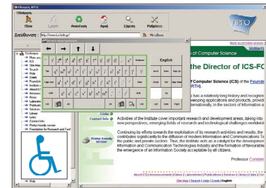
Το Σύστημα "ΑΡΓΩ" για χρήστες με κινητική αναπηρία

* Το Σύστημα "ΑΡΓΩ" λειτουργεί πιλοτικά σε δύο δήμους της χώρας, στο Δήμο Χορταργού Ν. Αττικής και στο Δήμο Νεάπολης Ν. Θεσσαλονίκης.