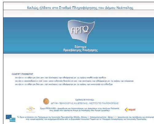
Αρχική οθόνη του Συστήματος "ΑΡΓΩ"

Το Σύστημα "ΑΡΓΩ" υποστηρίζει όλες τις τυπικές λειτουργίες μιας εφαρμογής πληροφόρησης και επιπλέον περιλαμβάνει: